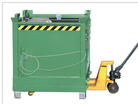
FB avec couvercle