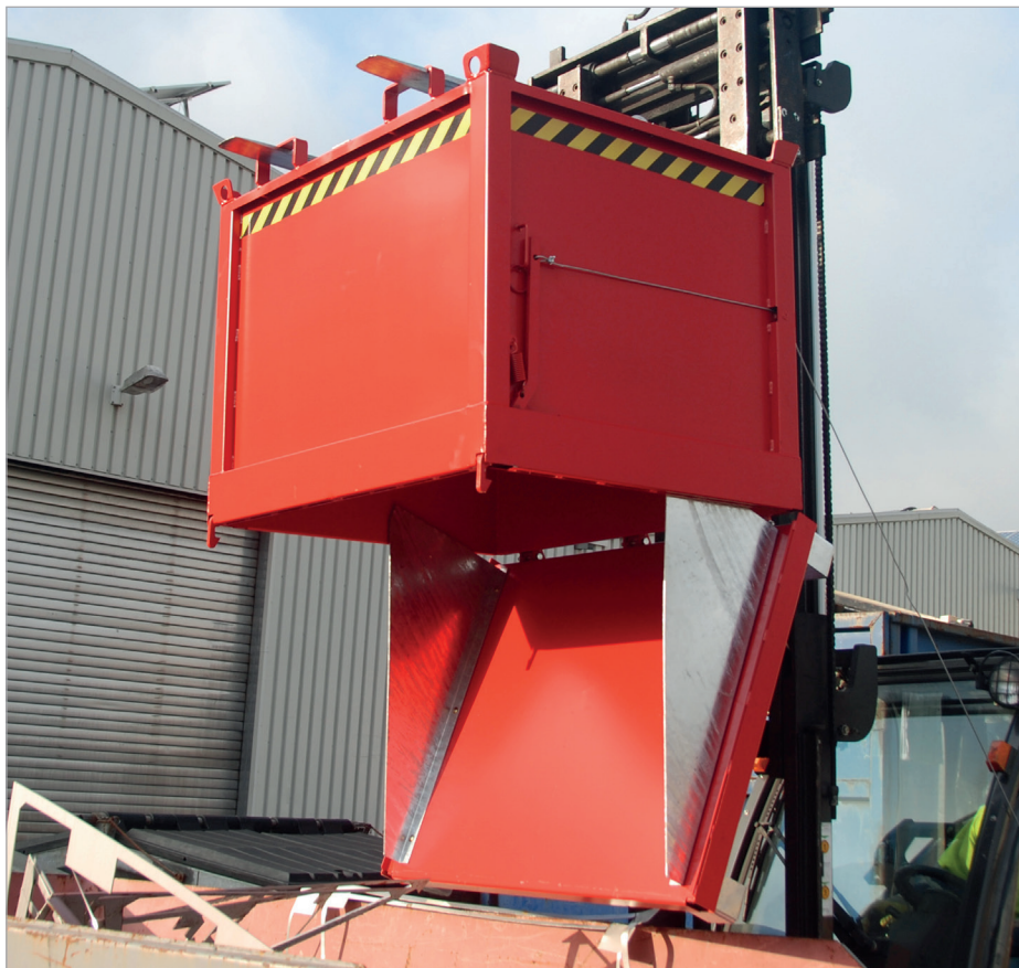
FB à parois de centrages