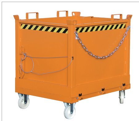
FB à roulettes