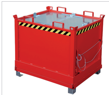
FB avec couvercle